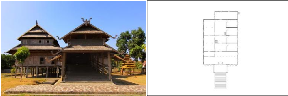
Gambar 1. Dalam loka (tampak depan dan denah)