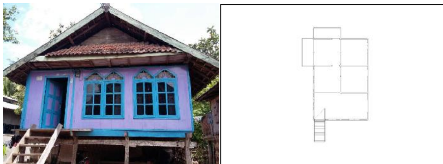
Gambar 3. Bale Panggung (tampak dan denah)