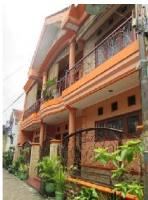
Gambar 9. Rumah Ibu Sa'diah Marfadia

Pemilik saat diwawancarai terkesan terburu-buru dan sedang siap-siap untuk pergi. Rumah ini adalah rumah asli milik orang tua beliau. Sudah 50 tahun beliau tinggal di rumah ini. Rumah ini terakhir direnovasi 15 tahun yang lalu. Rumah ini dihuni oleh 6 anggota keluarga beliau.