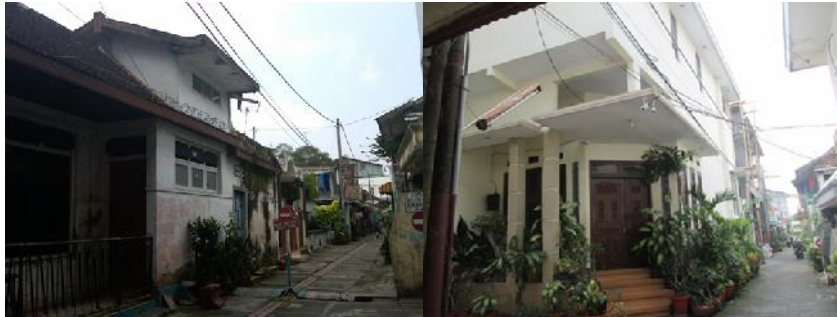
Gambar 4. Keadaan Rumah Sebelum dan Sesudah Di Renovasi

Pemilik rumah dan keluarganya adalah orang yang sebelumnya memang tinggal di perkampungan. Pada tahun 2006 beliau membeli rumah ini, pemilik tidak terbuka mengenai harga saat membeli rumah tersebut. Rumah tersebut kemudian dikontrakkan beberapa kali dan kemudian merenovasinya pada tahun 2011.