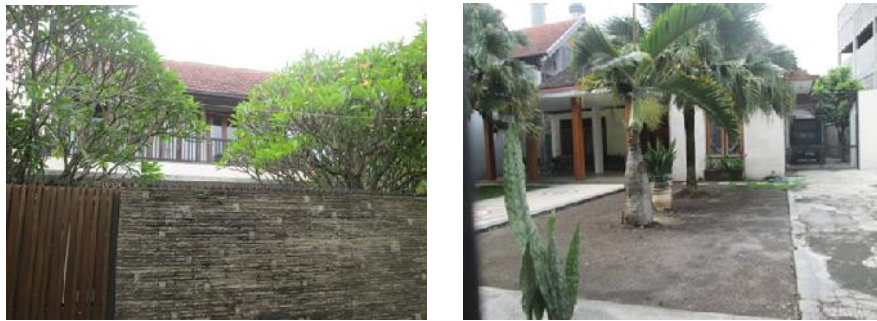
Gambar 3. Rumah No 1 dan No 2

merenovasi untuk menambah kamar dan ruangan di bagian belakang rumah. Sampai pada tahun 1990-an, keluarga Jabli bertotal 13 orang anggota keluarga yang tinggal di rumah ini.