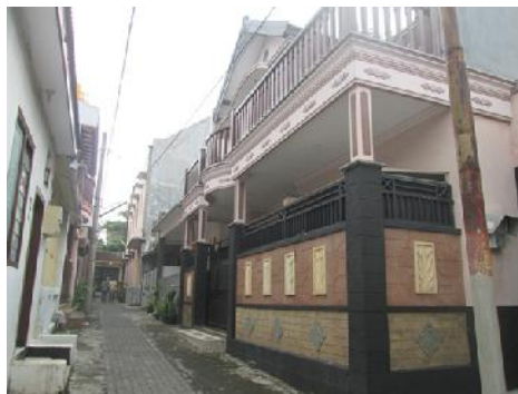
Gambar 7. Rumah Bapak Husein

Melihat fasilitas arsitektural yang ada di rumah ini, antara lain, dinding, ornamen, keramik, kusen dan pintu, maka peneliti memperkirakan harga bangunan ini adalah Rp. 400 juta. Tidak termasuk harga tanah.