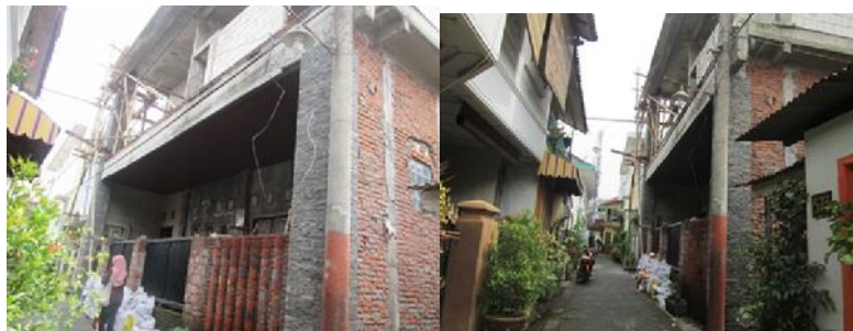
Gambar 6. Rumah Bapak Udin Saat Wawancara Dilakukan

Pembangunan rumah baru diatas tanah rumah lama dilakukan dari tahun 2015 dan sampai saat wawancara dilakukan, rumah baru masih dalam tahapan finishing. Rumah baru beliau bangun seluas ± 350 m 2 yang dibangun 3 lantai + lantai jemuran. Melihat fitur struktur dan finishing bangunan, penulis memeperkirakan bahwa harga rumah baru adalah Rp. 600 Juta.