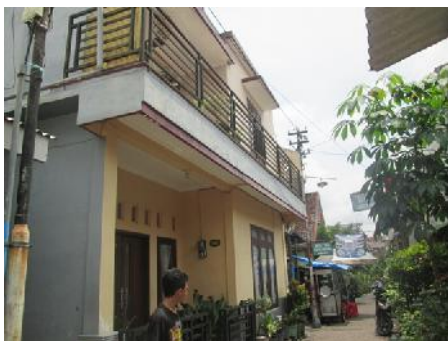
Gambar 8. Rumah Bapak Umar Assegaf

Uniknya rumah ini dulunya dihuni oleh 13 orang anggota keluarga Assegaf. Orang tua beliau dan 11 anaknya. Sejalan dengan waktu, ke 11 orang itu mulai berkeluarga dan memiliki rumah sendiri. Sedangkan Bapak Umar Assegaf sebelumnya memang tinggal di rumah ini beserta anak istri, tetapi sejak anaknya sudah berkeluarga, dan istri beliau meninggal dunia, beliau memilih untuk tinggal bersama keluarga anaknya di rumah lain. Sehingga rumah ini menjadi rumah tinggal yang seringkali kosong. Hanya pada saat weekend beliau beserta keluarganya juga kakak dan adiknya berada di rumah ini. Dengan kata lain rumah ini sekarang berfungsi sebagai rumah singgah keluarga.