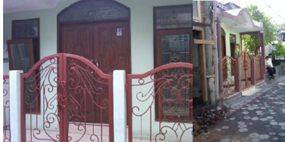
Gambar 5. Rumah yang pertama di beli oleh Bapak Udin.

Bapak Udin sebelumnya membeli rumah sederhana di kampung Kauman pada tahun 2013. Rumah pertama ini kecil dalam ukuran, yaitu kurang lebih 40 m 2 . Selama hampir satu tahun, beliau tinggal bersama keluarga di rumah kecil ini. Rumah ini dibeli dengan harga ± Rp. 80 juta. Kemudian beliau renovasi menghabiskan dana ± Rp. 50 Juta. Renovasi dilakukan dengan memperbaharui keramik, kusen, menambah ruangan dan pagar.