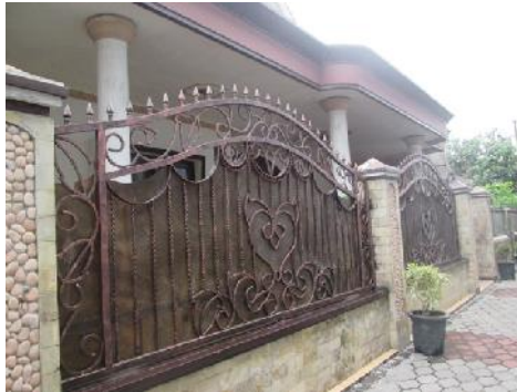
Gambar 10. Rumah Bapak Alibafana

Dari luasan rumah yang \pm 300 m 2 rumah ini dihuni oleh hanya 2 orang saja, yaitu ibu Wardah dan suaminya, yang keduanya berusia \pm 70 tahun. Sedangkan putra putrinya tidak tinggal di rumah ini. Diperkirakan oleh peneliti, rumah ini bernilai Rp. 500 juta