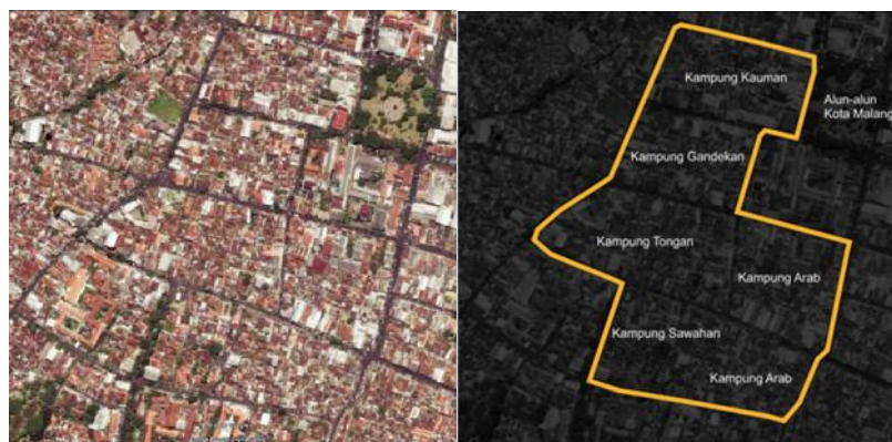
Gambar 1. Area Batasan Kawasan Penelitian

Populasi Penelitian dilakukan di tiga kampung-kampung tua di Malang antara lain, Kampung Kauman, Kampung Gandekan, Kampung Tongan, kampung Sawahan dan Kampung Arab. Kampung kampung tersebut menurut penelitian awal, banyak berdiri rumah-rumah mewah di dalam kampung.