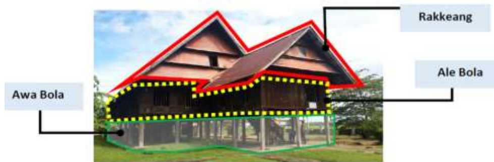
Gambar 2. Penataan ruang Saoraja Lapinceng secara vertikal