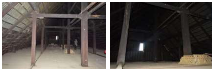
Gambar 3. Kondisi rakkeang sebagai ruang tinggal penghuni perempuan (anak gadis)

Selain difungsikan sebagai ruang tempat tinggal penghuni perempuan. Ruang ini juga digunakan sebagai tempat penyimpanan mayat penghuni rumah. Raja Balusu dan para penasehat kerajaan menganggap ruang tertinggi pada suatu rumah merupakan tempat yang paling tepat untuk mensemayamkan mayat. Hal ini didasari oleh anggapan masyarakat bahwa mayat dapat dengan mudah sampai ke surga apabila diletakkan ditempat yang tinggi. Adapun posisi terbaik penempatan mayat diletakkan didekat jendela loteng karena jendela dianggap sebagai jembatan antara dunia dan alam ghaib. Di tempat tersebut terdapat tiga balok menjorok dan mengapit pada kolom rumah. Balok-balok tersebut diperkirakan sebagai tempat atau dudukan dalam peletakan jenazah menggunakan peti.