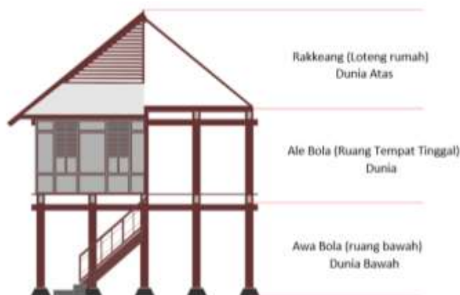
Gambar 1. Pembagian ruang spasial rumah tradisional Bugis