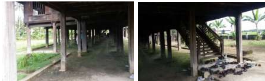
Gambar 6. Kondisi awa bola Saoraja Lapinceng

Dikatakan sebagai kaki rumah karena ruang tanpa dinding ini memiliki jumlah kolom yang banyak sehingga menyerupai seperti kaki. Demikian halnya dengan fungsinya sebagai ruang penggerak dan pendukung segala aktivitas perekonomian penghuninya. Sehingga kolong rumah juga memiliki andil yang cukup besar dalam proses kehidupan yang berlangsung pada Saoraja Lapinceng.