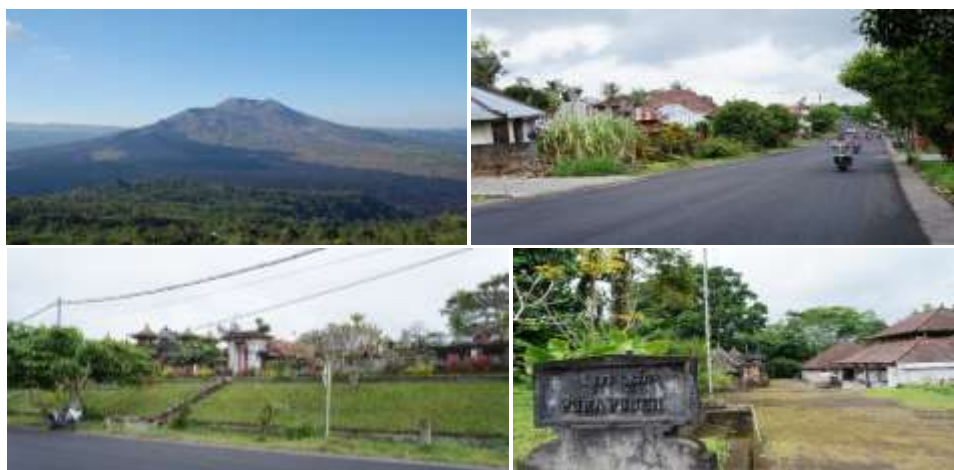
Gambar 3. Suasana permukiman Desa Sekardadi (searah jarum jam)

Pengaturan pola spasial desa yang dilandasi oleh konsep Hulu-Teben dan Tri Hita Karana , memungkinkan Desa Sekardadi memiliki pola linier ( linear pattern ). Jalan utama desa yang membentang dari utara ke selatan merupakan pusat yang tidak hanya berfungsi sebagai sirkulasi umum, tetapi juga berfungsi sebagai ruang terbuka yang menghubungkan pintu masuk pekarangan setiap rumah. Posisi jalan lebih rendah dari unit hunian yang mengapit jalan desa, lihat Gambar 3. Selain itu, pusat juga memiliki makna sebagai orientasi ruang publik saat melaksanakan upacara adat (Manik, 2007). Pintu-pintu pekarangan dari setiap unit hunian mengarah atau berorientasi ke jalan utama desa. Pekarangan hanya berfungsi sebagai tempat tinggal untuk mengadakan upacara dan berhubungan dengan keluarga. Untuk memenuhi kebutuhan hidupnya, penduduk mengusahakan kebun/ladang ( pategalan ) di luar desa atau di luar kawasan perumahan. Keterbatasan lahan dan keinginan untuk berinteraksi dengan jalan utama menyebabkan terjadi pengembangan perumahan ke arah luanan/hulu , tetapi tetap mempertahankan untuk tidak membangun di luanan Pura.