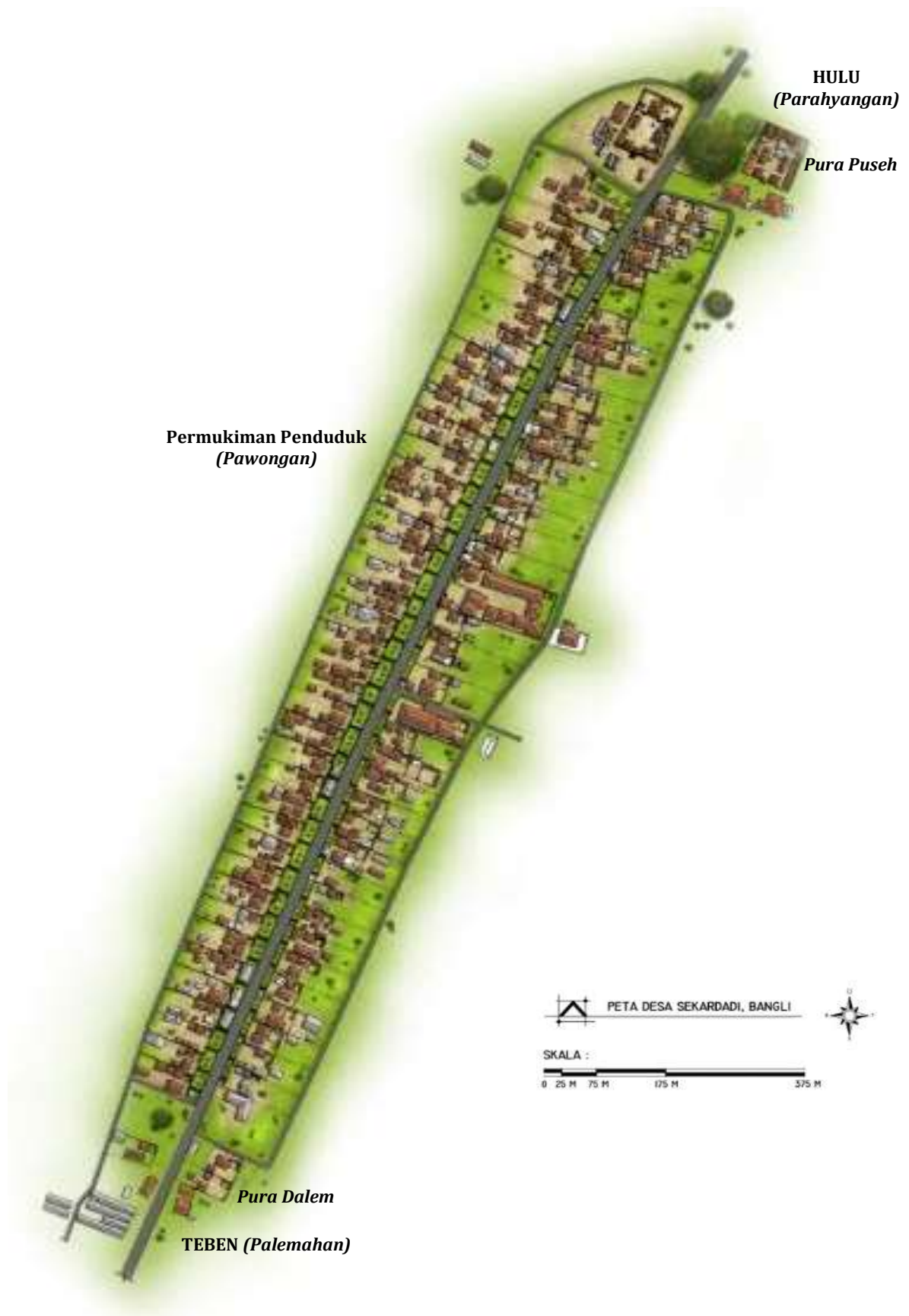
Gambar 2. Pola linier desa merupakan perwujudan dari konsep hulu-teben