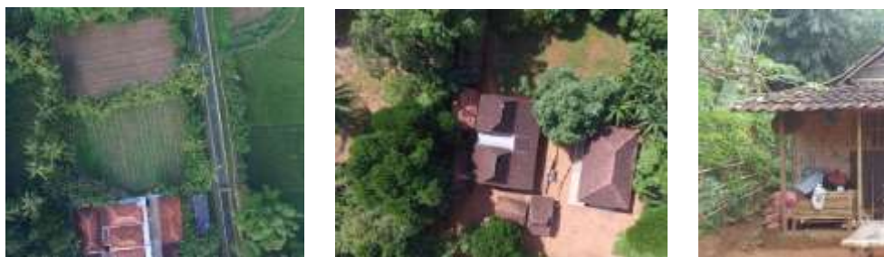
Gambar 3. Batas hirarki antar hunian dengan pagar hidup dari semak belukar dan pepohonan

Tanèyan lanjhèng disamping menentukan kelas sosial pemiliknya, juga mengandung makna dan nilai-nilai keislaman pada nilai kekerabatan. Pertama hal tersebut tercermin pada saat acara mentah saporah (saling bermaafan) saat hari raya Idul Fitri. Kedua, posisi tanèyan lanjhèng yang berada pada posisi epicentrum menunjukkan bahwa orang Madura sedemikian memandang vital rasa persaudaraan (kekerabatan). Ketiga , pintu masuk di ujung tanèyan lanjhèng biasanya diposisikan secara berhadapan dengan kobung , berfungsi untuk pengawasan terhadap hewan ternak, tamu yang datang dan fungsi perlindungan terhadap wanita yang ada di rumah inti.