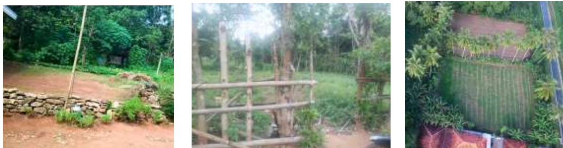
Gambar 4. Batas agraris: peninggian tanah, tanaman hidup, rangka bambu dan pohon

Sebagai bagian dari masyarakat peladang yang mempunyai nilai sosial yang tinggi, hubungan antar keluarga inti dalam satu cluster tanèyan lanjèng adalah sangat erat. Sebaliknya hubungan antar keluarga (antar cluster tanèyan lanjèng ) hidup berjauhan dan terpencar karena beberapa hal seperti kondisi topografi, hubungan antara hunian dengan lanskap agrarisnya (tegal) dan faktor sosial.