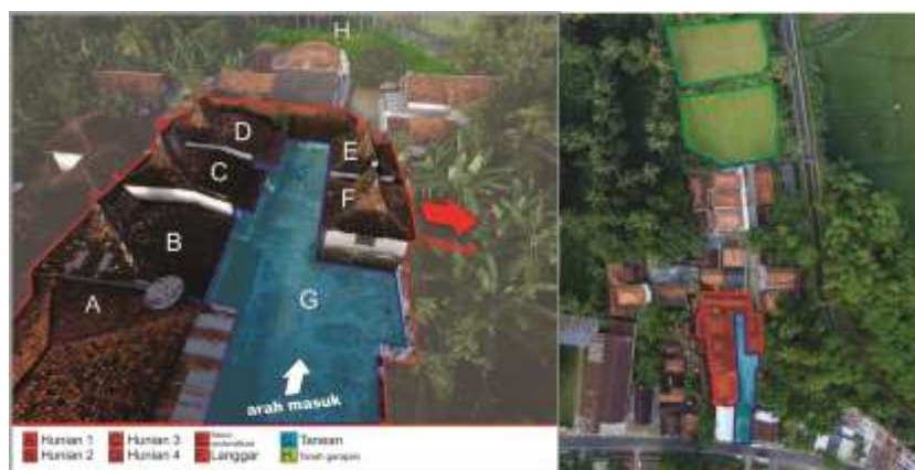
Gambar 1. Sampel 1 tanèyan lanjhèng di Kota Sumenep (Sumber: Dokumentasi survei lapangan menggunakan drone, 2016)

Kenyataan bahwa masyarakat Madura lebih sering menikah antar kaum kerabatnya sendiri. Karena banyaknya perkawinan antar kerabat disamping menyetujui konsep uksorilokal , mereka juga menyetujui konsep virilokal . Konsep uksorilokal berhubungan erat dengan konsep matrilokal , yaitu suami bertempat tinggal di sebelah rumah orangtua istri. Kultur tanean lanjeng yang terutama berbijak pada basis uksorilokal dan matrilokal yang berakulturasi dengan ajaran Islam (sebagai agama dominan dalam penduduk Madura) terutama tentang posisi ibu terhadap anak-anaknya, menyebabkan terbangunnya kultur penghormatan kepada ibu menempati posisi utama, menyusul si bapak.