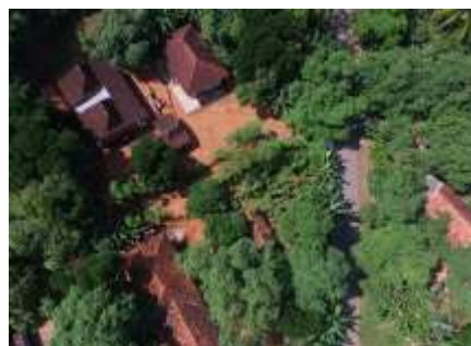
Gambar 6. Sampel 2 di Kabupaten Sumenep