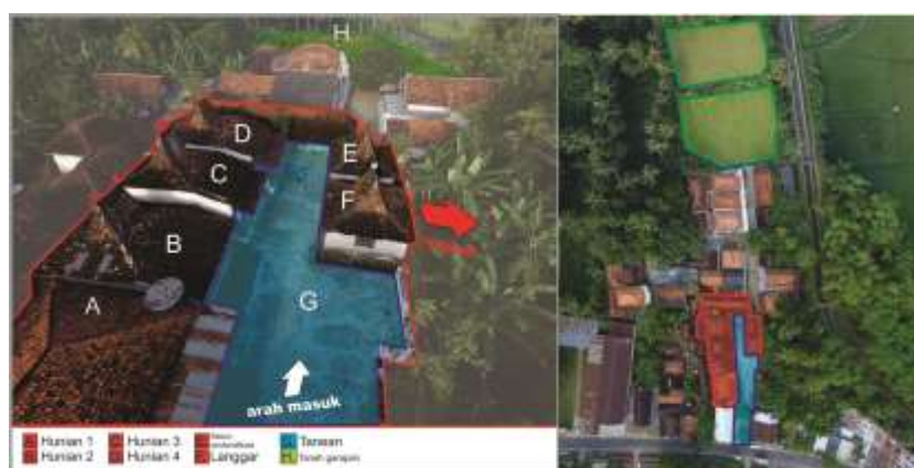
Gambar 1. Sampel 1 tanèyan lanjhèng di Kota Sumenep

Kenyataan bahwa masyarakat Madura lebih sering menikah antar kaum kerabatnya sendiri. Karena banyaknya perkawinan antar kerabat disamping menyetujui konsep uksorilokal , mereka juga menyetujui konsep virilokal . Konsep uksorilokal berhubungan erat dengan konsep matrilokal , yaitu suami bertempat tinggal di sebelah rumah orangtua istri. Kultur tanean lanjeng yang terutama berbijak pada basis uksorilokal dan matrilokal yang berakulturasi dengan ajaran Islam (sebagai agama dominan dalam penduduk Madura) terutama tentang posisi ibu terhadap anak-anaknya, menyebabkan terbangunnya kultur penghormatan kepada ibu menempati posisi utama, menyusul si bapak.