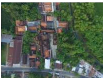
Gambar 5. Sampel 1 di Kota Sumenep

Dengan semangat individualisme yang lebih tinggi dibandingkan penduduk setempat, pemukiman orang-orang Madura di perantauan lebih dihasilkan oleh labor ethics daripada land ethics . Hasilnya adalah pengambilan wilayah-wilayah kerja penduduk lokal oleh orang-orang Madura. Dugaan demikian dapat dilihat di Sampit dan Sambas, yang bukan saja mengambil wilayah melainkan juga sektor-sektor pekerjaan yang secara tradisional dikuasai oleh penduduk asli. Sifat individualistik yang dibentuk akibat ekologi tegalan itu melahirkan karakteristik orang Madura yang lebih mengutamakan rasionalisasi ekonomi: kesederhanaan, kerja keras, dan sifat berhemat. Boleh jadi keunggulan bawaan ekotipe tegalan itulah menimbulkan problem tersendiri dalam hubungan sosial orang-orang Madura di perantauan.