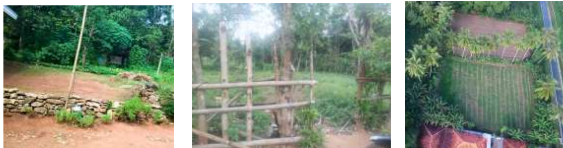
Gambar 4. Batas agraris: peninggian tanah, tanaman hidup, rangka bambu dan pohon (sumber: Dokumentasi survei lapangan, 2016)

Sebagai bagian dari masyarakat peladang yang mempunyai nilai sosial yang tinggi, hubungan antar keluarga inti dalam satu cluster tanèyan lanjèng adalah sangat erat. Sebaliknya hubungan antar keluarga (antar cluster tanèyan lanjèng ) hidup berjauhan dan terpencar karena beberapa hal seperti kondisi topografi, hubungan antara hunian dengan lanskap agrarisnya (tegal) dan faktor sosial.