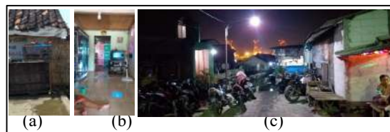
Gambar 4. Bentuk Adaptasi Perilaku di Permukiman Tambak Lorok

Perubahan perilaku individu yang dapat menyebabkan perubahan lingkungan yang pada dasarnya dapat meningkatkan kesesuaian di antara keduanya adalah bentuk adaptasi perilaku (Berry, 1980). Foto 4.B.a. merupakan penempatan hewan peliharaan yang diletakkan diatas perabot agar terhindar dari banjir. Foto 4.B.b. adalah barang elektronik yang diletakkan diatas meja serta lantai dasar yang dibuat bersih agar lumpur/kotoran pasca banjir dapat dibersihkan dengan mudah. Foto 4.B.c. adalah kendaraan yang diletakkan di ujung jalan yang tidak tergenang banjir menjadi hal yang biasa dilakukan di Tambak Lorok. Warga yang hendak menjangkau tempat tinggalnya biasanya memarkirkan kendaraannya diujung jalan yang bebas banjir dan harus jalan kaki menuju rumahnya. Banjir rob menjadikan tiap-tiap individu untuk terus meningkatkan kesesuaian dengan perubahan lingkungan.