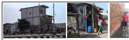
Gambar 3. Adaptasi Penyesuaian meninggikan Pondasi Bangunan di Tambak Lorok

Strategi penyesuaian dengan adaptasi tapak/ bangunan tunggal seperti yang diungkapkan Bloomberg dan Burden (2013) dikategorikan menjadi dua, yaitu: membangun dengan konstruksi baru dan membangun dengan renovasi. Strategi tapak dilakukan dengan membuat bangunan tahan banjir dan mencegah kerusakan terhadap bangunan beserta isinya. Upaya adaptasi bangunan tunggal di Tambak Lorok dilakukan dengan meninggikan pondasi bangunan (93%) (Gambar 3).